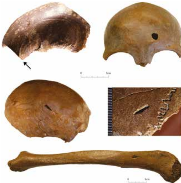
Figuur 3. Menselijk botmateriaal uit de late ijzertijd met sporen van antieke verwondingen, aangetroffen in de oude Maasbedding bij Kessel/Lith

De archeologische gegevens uit de late ijzertijd, opgebaggerd te Kessel/Lith, lijken het bovengeschetste historische scenario van een veldslag van Caesar te versterken. De voor Nederland unieke concentratie van menselijk botmateriaal en wapentuig suggereert een directe relatie met een grootschalig militair conflict. Hard bewijs voor een link met de veldslag uit 55 v.Chr. is evenwel niet te leveren, simpelweg omdat het betreffende vondstmateriaal een dergelijke nauw-