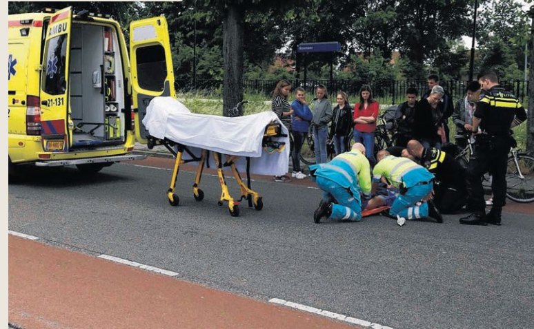
▲ Een fietser heeft gistermiddag beenletsel opgelopen bij een aanrijding met een auto op de Stationsweg in Boxmeer. Zowel de automobilist als de jongen op de fiets wilden een stilstaande bus inhalen. Hierbij zagen ze elkaar over het hoofd.