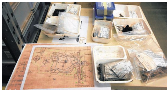
▲ Een schets van het Valkhof en resten van opgravingen daar aangetroffen.