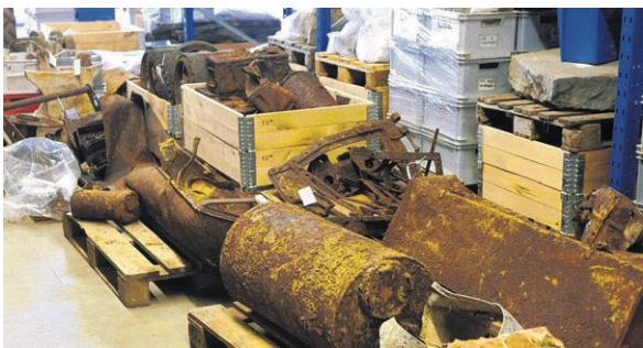
▲ Resten uit een ondergronds verblijf in Brakkenstein van Amerikaanse militairen eind 1944.

Nijmegen denkt samen met de provincie en Arnhem na over een concentratie van de archeologische depots in Gelderland. Nijmegen ziet dit als een kans om de archeologie nog meer onder de aandacht van een grote publiek te brengen. Zo wil Nijmegen bij het depot ook een publieksruimte inrichten waar bezoekers kunnen zien hoe restaurateurs aan de kunstwerken werken en waar ze bijzondere archeologische vondsten kunnen bekijken. Een van de locaties die in beeld is, is de Vasim in Nijmegen. Eind dit jaar moet helder zijn wat de beste locatie is.