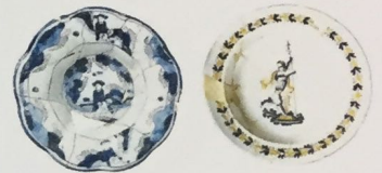
Sierschotel, faience, deltsblauw aardewerk. Datering 1725-1750. Gevonden aan de Grotestraat/Vleeshouwerstraat.