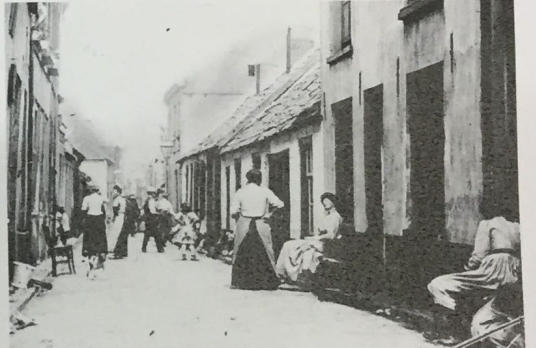
Een beeld van de Piersonstraat rond 1900. Het gevonden materiaal stamt ook uit die tijd.