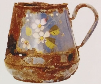
Geëmailleerd vaatwerk, wellicht uit Duitsland. Datering: rond 1900. Gevonden in de Piersonstraat.