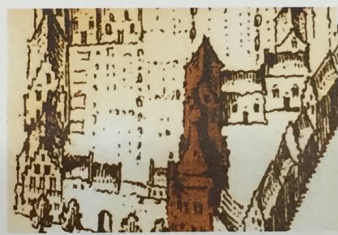
Detail uit schilderij van Hendrik Feltman (links). Het is een vogelvluchtplan van de stad Nijmegen, geschilderd in 1667-'68. De onderste horizontale gebogen straat is de Ridderstraat waar de Hof van Batenburg lag. Die is in bruine tinten te zien op de bovenstaande tekening.

Bij opgravingen op de Elermarkt, op de hoek van de Ridderstraat en de Stockumstraat werd in 1982 een grote rechthoekige beerput ontdekt. Het exclusieve materiaal dat erin werd gevonden werd gecombineerd met historische bronnen. Zo identificeerden de archeologen het huis waar de put ooit toe behoorde als de Hof van Batenburg. Het gebouw was er in 1982 al niet meer; het werd gesloopt in 1982. De Hof van Batenburg werd in de veertiende of vijftiende eeuw vermoedelijk gebouwd als ridderhuys . Daar konden ridders verblijven die te gast waren bij de vorst die resideerde op het nabijge Valkhof. In 1460 ging het gebouw over in handen van Gysbert, heer tot Batenborch. Vandaar de naam Hof van Batenburg. In 1612 nam burgemeester J. Kelfken de helft van de hof over van de toenmalige adellijke eigenaar, de familie Van Bronckhorst. Ook in latere eeuwen werd het huis bevolkt door voornamelijk bewoners: de familie Roukens (met name bekend door de fameuze schepen, geleerde en dichter Johan Michiel Roukens). In de negentiende en twintigste eeuw wisselde het gebouw nog een aantal keer van eigenaar en waren er achtereenvolgens een meisjesschool, een hotel, een deel van het gemeentelijk ambtenarenapparaat en een reclamebureau in gevestigd. Het enige dat er nu nog rest, is een gevelsteen met wapen van de familie Roukens en een monumentale voordeur. Het materiaal dat de archeologen in de beer-