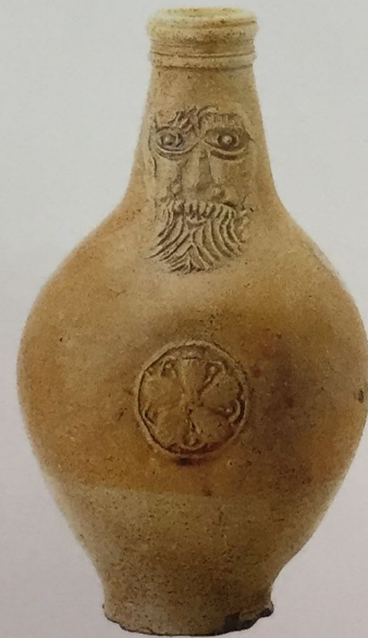
Kan met baardman, steengoed Frechen/Keulen. Datering: 1750-1800. Gevonden aan de Elermarkt.