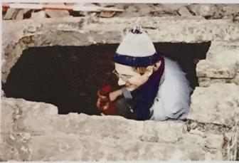
Een archeoloog aan het werk in een beerput. Sommige putten vertellen het verhaal van vele eeuwen en de veranderingen die Nijmegen in die tijd heeft doorgemaakt. Wat voor servies gebruikten de mensen, wat voor eten aten ze, hoe luxe richtten ze hun huizen in? Ook modes en rages zijn zo te volgen. Door beerputten van welgestelden te vergelijken met die van minder gefortuneerden, kunnen de onderzoekers volgen hoe een luxegedoe langzaam doorsijpelt naar het gewone volk.