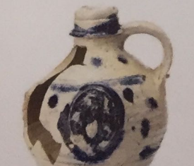
Kannetje, steengoed Westerwald. Datering 1750-1800. Gevonden aan Grotestraat/Vleeshouwerstraat.