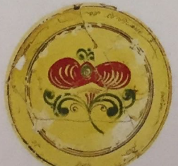
Sierschotel van wit aardewerk uit Frechen. Datering? Gevonden aan de Piersonstraat.